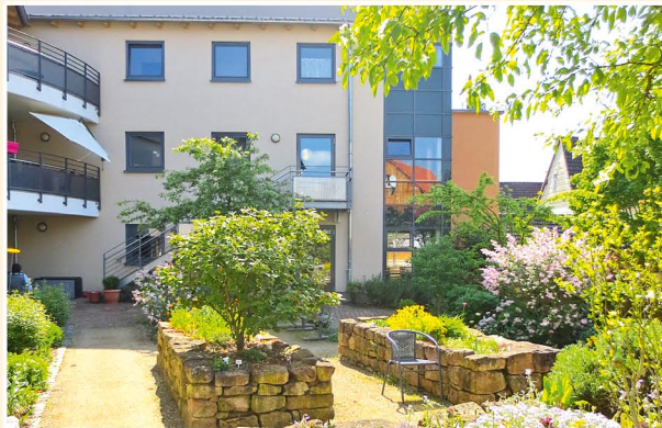
BLICK IN DEN SINNESGARTEN