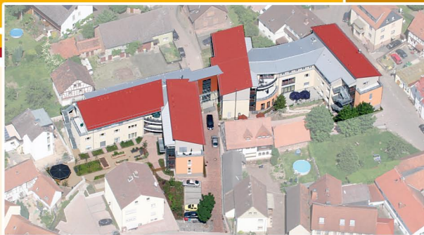
LUFTBILD GESAMTER KOMPLEX

Leben mit anderen - Menschen in Gemeinschaft